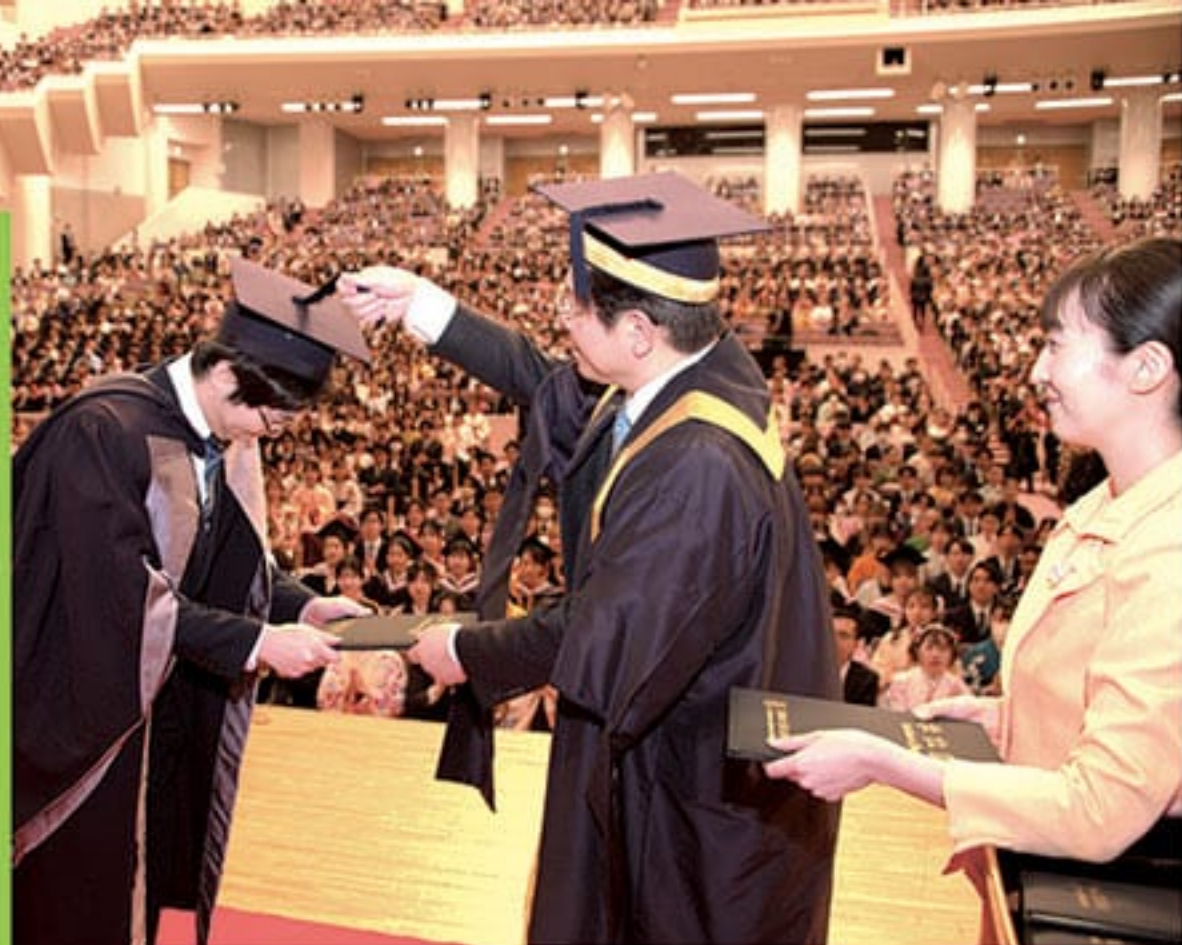
3/18创价大学举办第50届创价大学毕业典礼·第38届创价女子短期大学毕业典礼

■ 第50届创价大学毕业典礼·第38届创价女子短期大学毕业典礼在池田纪念讲堂隆重举行。地球宪章国际本部米瑞安·维莱拉事务局长出席了典礼。