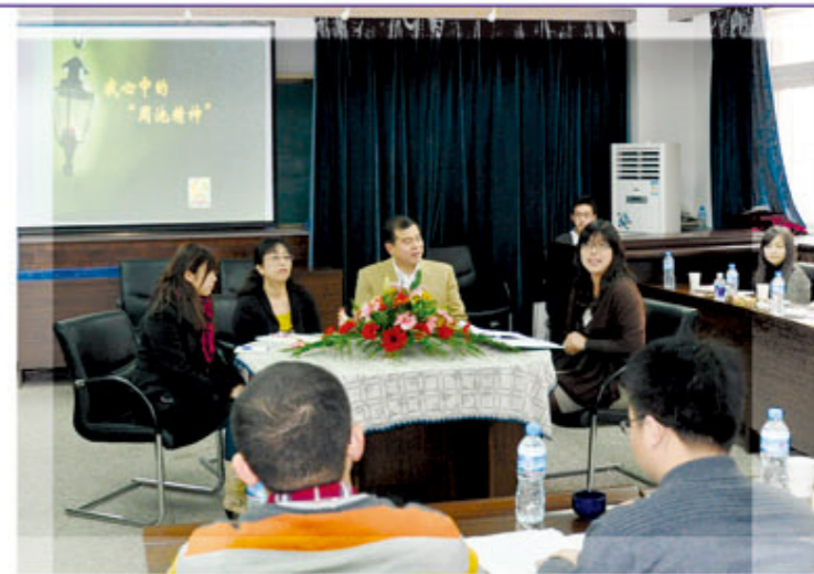
逸见女士接受南开大学学生的采访

有一天，有一位20多岁的中国男人来到我工作劳动局和我谈话，但是他中国口音比较重，我听不懂，而且他也不会写字，结果我没能理解。但是这个年轻人说：“谢谢您倾听我的苦恼。”就流着眼泪离开了。他走后，我去了外面，自责地想着：“怎么这样没用，连一个中国人也不能帮助，又怎么能说为日中友好做贡献呢？”