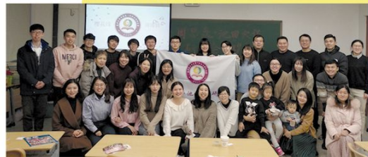
12月8日南开大学周恩来池田大作研究会

在1974年12月5日，重病在身的周恩来总理与我校创办人池田大作先生进行了历史性会见。为纪念两位会见45周年仲恺农业工程学院廖承志与池田大作研究会和南开大学周恩来池田大作研究会分别举办了纪念活动。