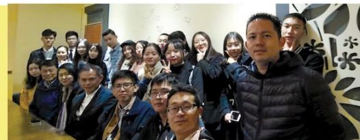
12月7日仲恺农业工程学院廖承志与池田大作研究会