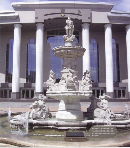
美奈卡喷泉——位于池田讲堂正前方， 作为文艺复兴时期的艺术品展出。该 艺术品是池田讲堂修建时从意大利 搬运过来的。